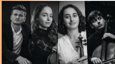
QUATUOR 134 VIOLON, ALTO, VIOLONCELLE & PIANO Brahms et Schumann

DE LA MAISON DE RETRAITE DU PETIT-SACONNEX - AVENUE TREMBLEY, 12